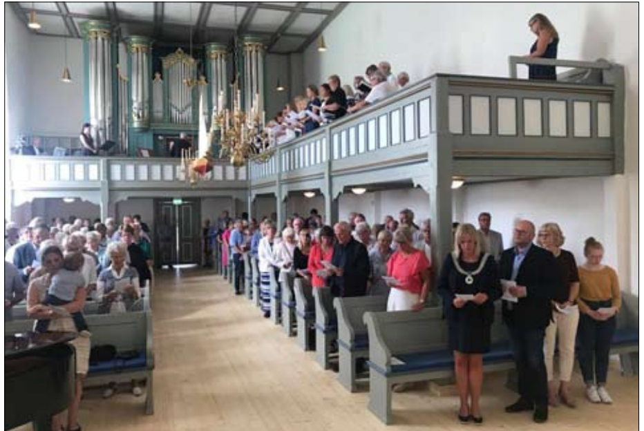
Med full kirke og ordfører på første benk ble dette en opplevelse av det helt store slaget!

Lørdag formiddag var kirken og bårhuset åpen for alle i Sande for å komme å se. Det strømmet faktisk på folk hele tiden! Folk likte det de så og folk virket takknemlig for at Sande har nå en helt spesiell flott kirke. Det er naturlig her og rette en takk igjen til kommunen for raushet og støtte til å kunne gjennomføre dette. Åpne kirken skal vi gjøre igjen.