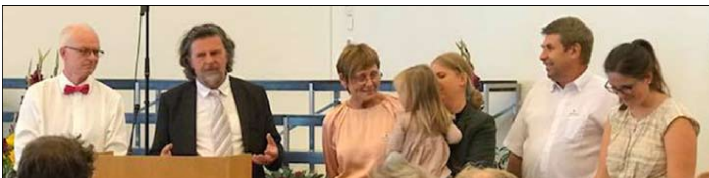
Staben for en takk av kirkevergen for den ekstra innsatsen de har gjort med stengt kirke.